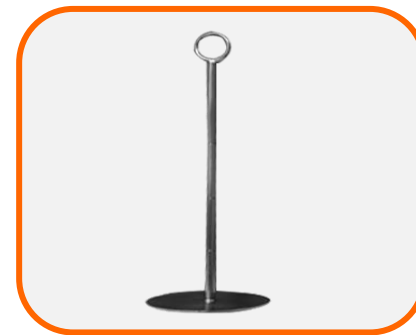
ก้านวัตน้ำมัน