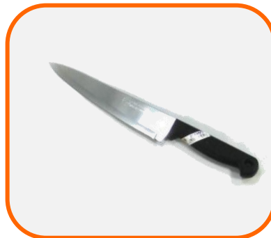
มีดปลายแหลม ขนาด 8 นิ้ว