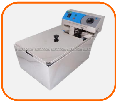
เตาทอดไฟฟ้า