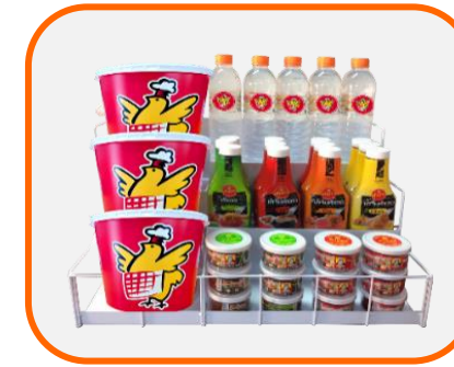
ชั้นโชว์สินค้า