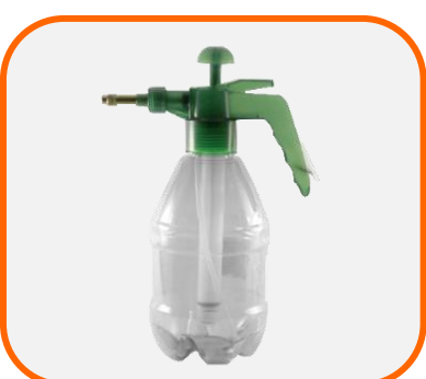
กระบอกฉีดน้ำ