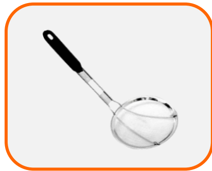
กระชอนตักกาก