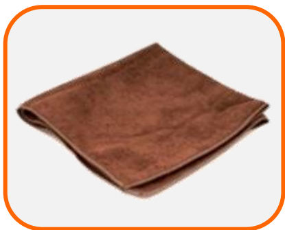
ผ้าไมโครไฟเบอร์