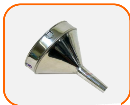
กรวยกรอง ขนาด 6 นิ้ว