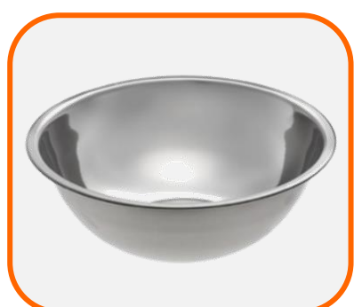
ชามสแตนเลส ขนาด 36 cm.