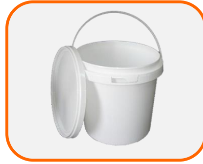
ถังน้ำสีขาว