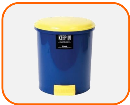
ถังขยะมีฝาปิด