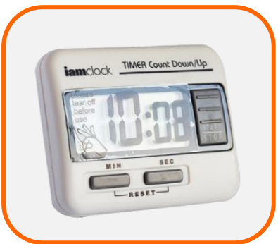
นาฬิกาจับเวลา