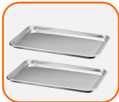
ถาดสแตนเลส 40*60*4.8 cm.