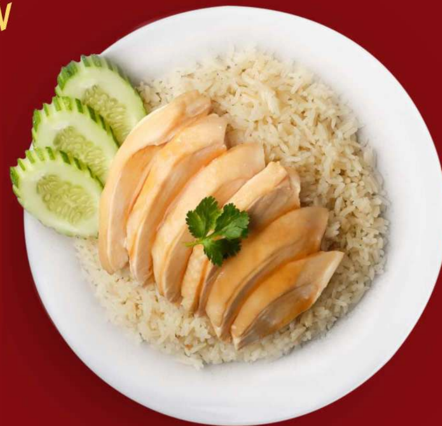
HINANESE CHICKEN RICE