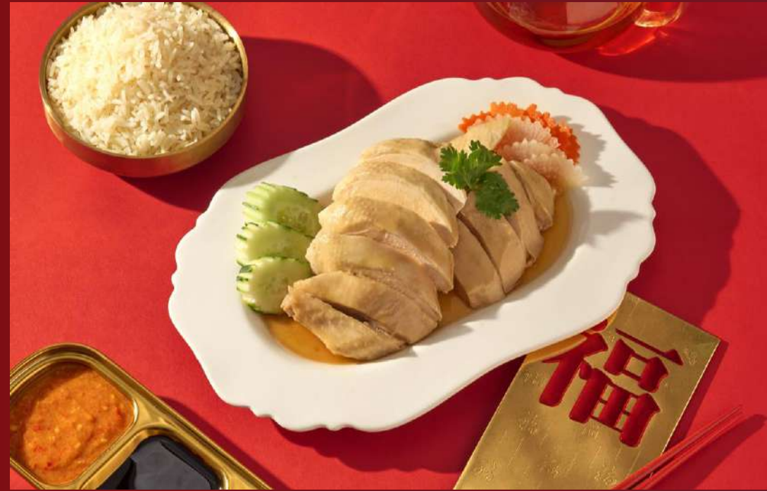
HINANESE CHICKEN RICE