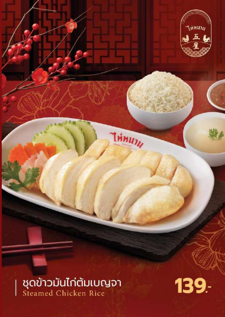
ชุดข้าวมันไก่ต้มเบญจา Steamed Chicken Rice