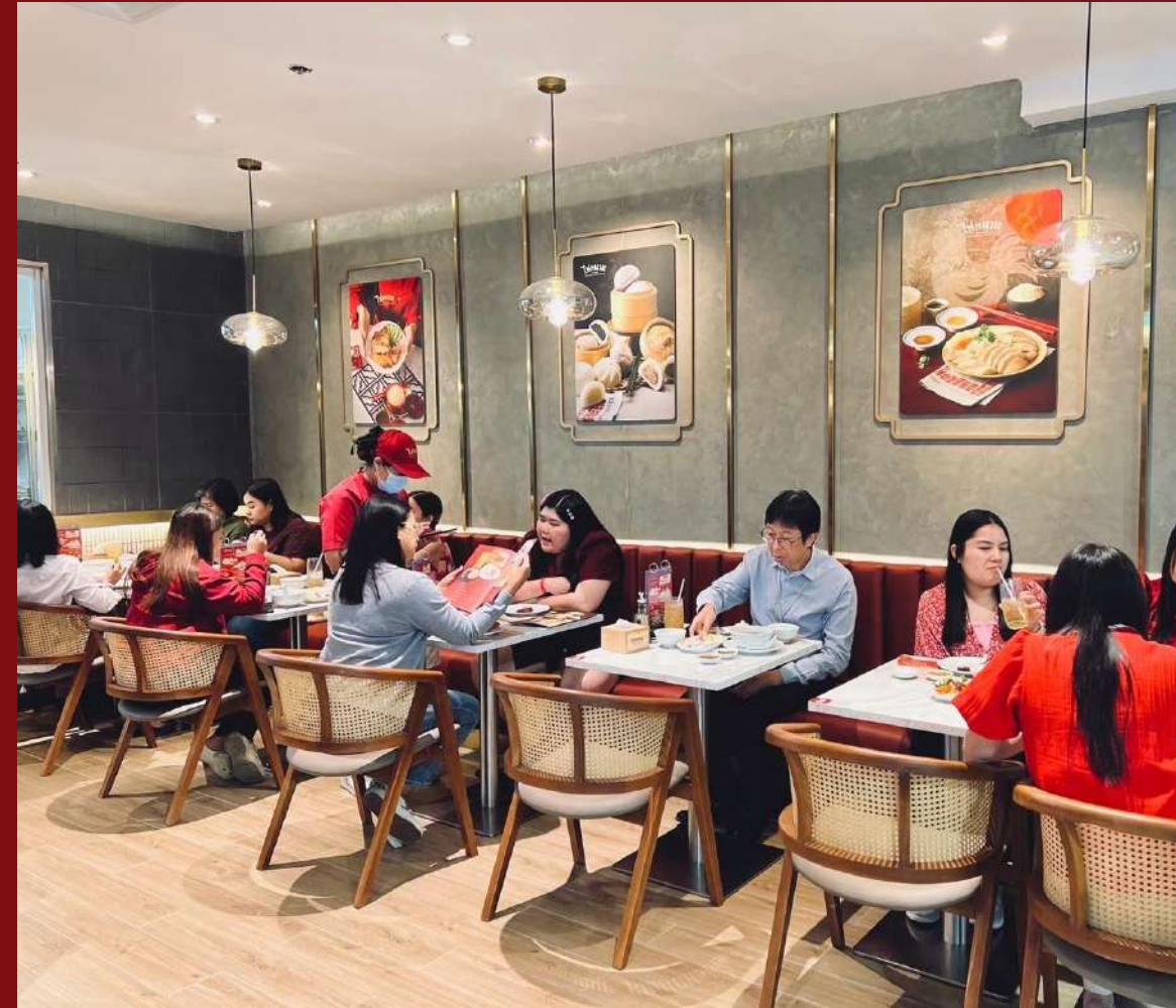
4. สาขา CP Tower 1 Silom